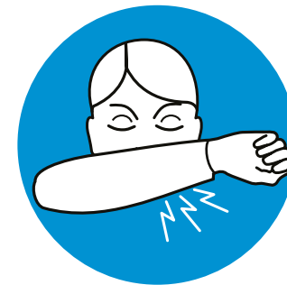
Husten & Niesen in Armbeuge